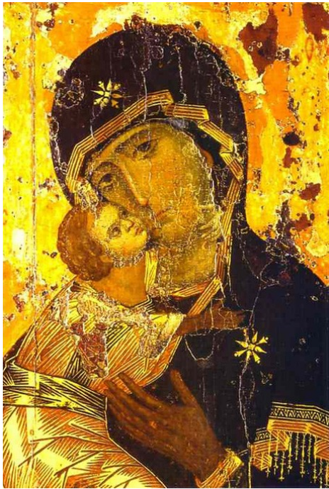
Mãe de Deus da ternura, séc. XII, Moscovo

E le começou a ensiná-los, dizendo: Bem-aventurados os pobres em espírito, – porque deles é o reino dos Céus. Bem-aventurados os humildes, – porque possuirão a terra. Bem-aventurados os que choram, – porque serão consolados. Bem-aventurados os que têm fome e sede de justiça, – porque serão saciados. Bem-aventurados os misericordiosos, – porque alcançarão misericórdia. Bem-aventurados os puros de coração, – porque verão a Deus. Bem-aventurados os que promovem a paz, – porque serão chamados filhos de Deus.