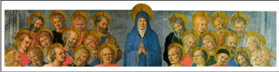
BEATO ANGÉLICO, Pentecostes , Igreja de São Marcos, c. 1448—1455.